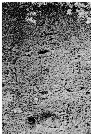
図4 廻国供養塔に刻まれた「天蓋」の文字