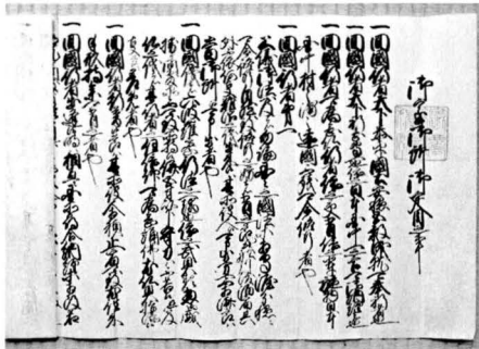
図5 御室御所御定目（部分）