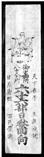
図7 御室八十八 カ所日参回向符 力所(長 33.5cm)